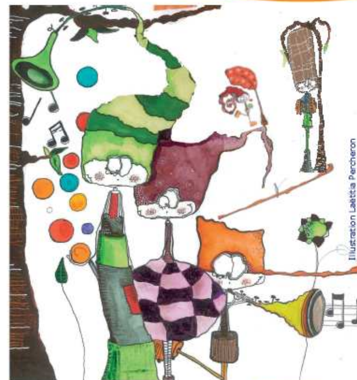
Illustration Laëtitia Percheron